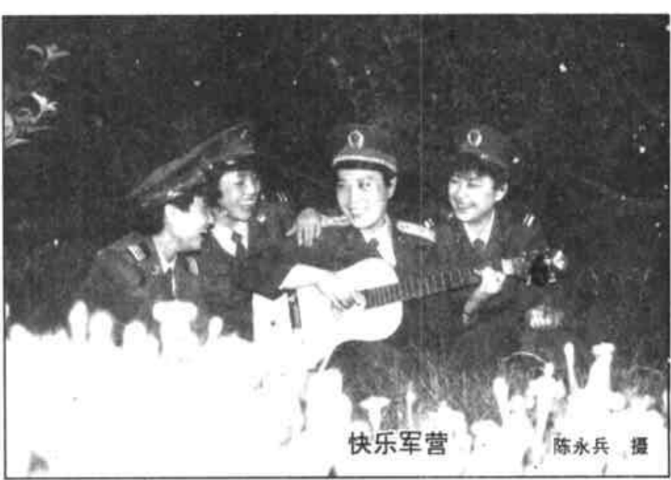
快乐军营

用钢丝球清洗铝制品，有时会将铝制品表面氧化层刮掉，露出银白色的金属铝，对人体有害。